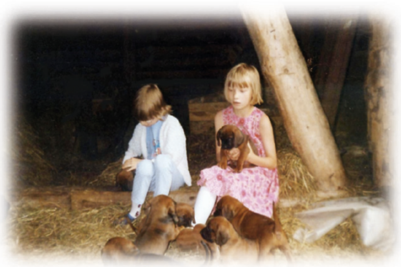
Ola i Emilka

Codziennie rano bawiła się w ogrodzie obok swojego domu. Ten poranek był jasny i pogodny, nic nie zapowiadało przygody. Nagle z lasu wybiegł ogromny pies, wprost na dziewczynkę. Wystraszona Kasia próbowała uciec do domu, ale drzwi były zamknięte. Stała więc ze zwierzęciem „oko w oko”. Jednak ku jej zdziwieniu, pies okazał dziewczynce sympatię, liżąc ją językiem w rękę. Okazało się, że jest to bardzo wesoły, kolorowy, kundelek. A ponieważ umiał mówić, poprosił Kasię, aby poszła za nim, bo ma jej coś ciekawego do pokazania.