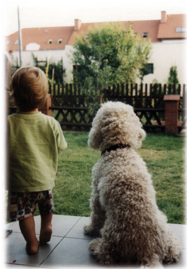
Zosia i Derus

tak samo jak on. Po dłuższej chwili Piotruś zszedł na dół, podszedł do psa, a ten podbiegł do niego szczęśliwy, machając ogonem i zaczął lizać chłopca po twarzy. A Piotruś roześmiał się radośnie i powiedział: