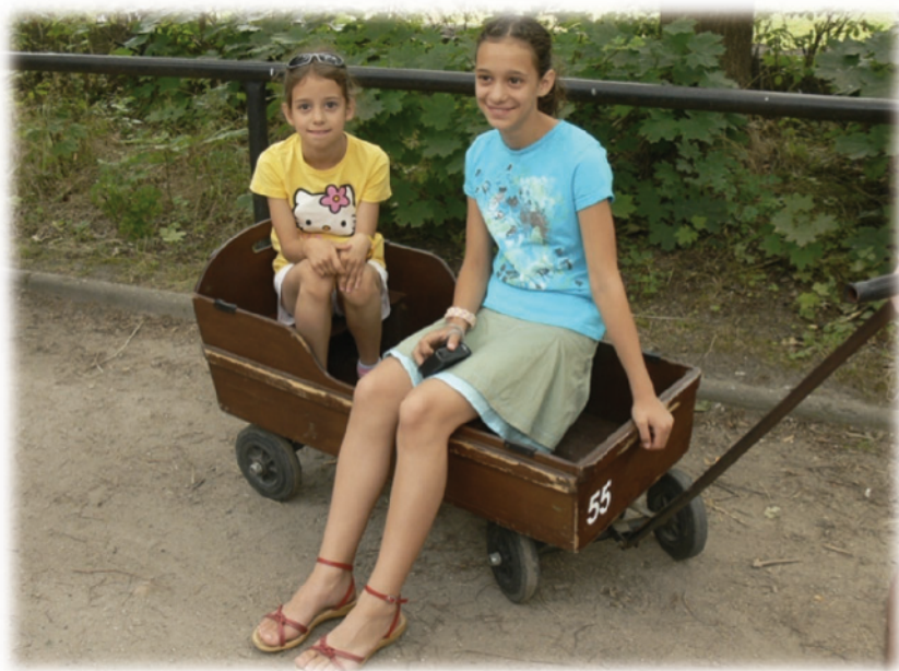
Ala i Zuzia

Nadszedł poniedziałek i wszystkie dzieci, włącznie z Żyrafkiem, pojawiły się w szkole. W klasie pod wielkim baobabem panowała przejmująca cisza. Dzieci już nie bawiły się tak jak kiedyś. Nikt nie wiedział, jak się z Żyrafkiem porozumieć, nikt nie chciał się też bawić bez Żyrafka, bo tylko z nim było fajnie.